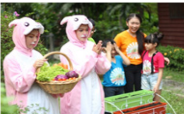
ภาพที่ 11 กระต่าย ในตอน Herbivore