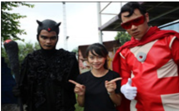
ภาพที่ 10 ปีศาจและวอกเกิ้ลแมน ใน ตอน “วอกเกิ้ล”

สื่อสารระหว่างผู้ผลิตรายการไปยังผู้รับสารที่เป็นเด็ก ในการคิดรูปแบบการสื่อสารยึดแนวคิดเบื้องต้นจากการ์ตูนแอนิเมชันที่ได้รับมอบมาจากสถานี และนำมาวางเป็นแนวคิดการเล่าเรื่องโดยพิธีกรทั้งสี่คนภายใต้แนวคิด “คิด วิเคราะห์ เรียนรู้” ซึ่งเราใช้การสื่อสารที่ให้อิทธิพลลงมือปฏิบัติจริง โดยเล่าเรื่องให้ผู้ชมทางบ้านผ่านลงมือทดลอง และมีการเพิ่มเติมข้อมูลผ่านเสียงบรรยาย หรือข้อมูลในรูปแบบอินโฟกราฟิก อีกทั้งบางตอนมีการสร้างตัวละครเสริมเข้ามาดึงดูดความสนใจผู้รับสารที่เป็นเด็ก เช่น วอกเกิ้ลแมน ปีศาจ ที่หมิวซ์โลก ไอโซนแมน กระต่าย