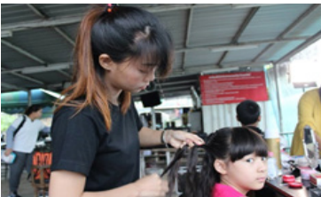
ภาพที่ 6 การแต่งหน้าและทำผมพิธีกร

2. ซ้อมการแสดง ในการถ่ายทำรายการทุกครั้ง โปรดิวเซอร์จะทำการกำกับพิธีกรและนักแสดงทั้งหมดให้มีการฝึกซ้อมบทพูด ซ้อมการแสดง ซ้อมจุดในการยืน รายละเอียดและท่าทางต่างๆ ในการแสดง ให้นักแสดงและพิธีกรทำความเข้าใจกับบทให้ได้มากที่สุด เพื่อที่จะให้งานออกมาเป็นไปตามเป้าหมายที่ได้วางไว้