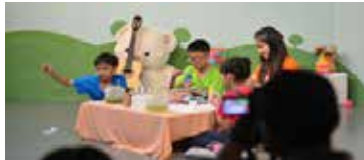
ภาพที่ 9 การถ่ายทำรายการทั้งในและนอกสตูดิโอ

4. การทดสอบการบันทึกเสียง บันทึกเสียงผ่านไมค์ไร้สาย (Wireless) ลงเครื่องควบคุม (Mixer) การบันทึกเสียงผ่านไมค์ไร้สาย เริ่มต้นด้วยการตรวจสอบถ่าน ทดสอบเสียง ตั้งค่าสัญญาณความถี่ของไมค์ไร้สาย (Wireless) การติดไมค์ไร้สายมี 2 ขั้นตอนคือ 1. ติดหัวไมค์ไว้ที่ด้านในของตัวเสื้อโดยใช้เทปกาว 2. ขอนัดส่งสัญญาณไว้ด้านหลังของพิธีกร โดยเก็บสายให้เรียบร้อยที่สุด ซึ่งในส่วนของพิธีกรที่เป็นผู้หญิงก็จะให้ทีมงานที่เป็นผู้หญิงติดแทน