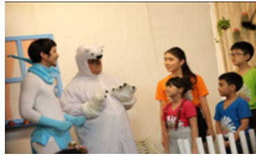
ภาพที่ 12 ที่หมิวซ์โลกและไอโซนแมน ในตอน Save me