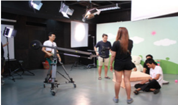
ภาพที่ 8 การวางมุกกล้อง