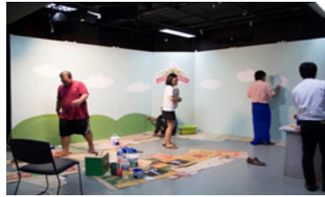
ภาพที่ 5 การทำฉากรายการในสตูดิโอ

4. ทำตารางการถ่ายทำ (Shooting script) การเขียนตารางการถ่ายทำ (Shooting script) กำหนดเวลาสถานที่ การบอกคิวการถ่ายทำของรายการให้อยู่ในระยะเวลาที่กำหนดคือ 09.00-16.00 น เพื่อให้กระบวนการผลิตอยู่ในระยะเวลาที่เรากำหนด