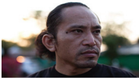
ภาพที่ 4 นักแสดงหลัก

นักแสดงตัวเอก ต้องรู้เรื่องการแสดงเนื่องจากตัวละครอื่นเราใช้ตัวละครจากในชุมชนจริงๆจึงต้องคัดเลือกนักแสดงที่มีความเข้าใจในภาษาอีสานและสามารถพูดอีสานได้