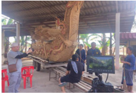
ภาพที่ 2 เขียนบท-ผู้กำกับ-กำกับภาพ-ตัดต่อ