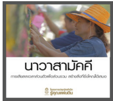
ภาพที่ 1 ภาพแนวคิดจากภาพยนตร์เรื่องนาวาสามัคคี