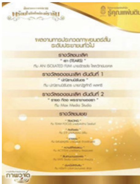
ภาพที่ 6 ภาพประกาศรางวัลครั้งที่ 6 ปี 2559

ที่ใช้สื่อสารกับเรื่องราวได้และการติดต่อแบบมอนทาจเป็น การรวบยอดแนวความคิดเพื่อเทียบกับเวลาจริงนำมาใช้ได้ เสมอเมื่อต้องการจะเล่าด้วยอารมณ์และจังหวะที่มีความขัดแย้งจากขนาดภาพ จากอารมณ์ กระตุ้นการรับรู้ได้เป็นอย่างดี เมื่อเราได้ผลิตภาพยนตร์จากแรงบันดาลใจด้วยความมุ่งมั่น และได้นำเสนอสิ่งที่ต้องการจะเล่าโดยสื่อสารอย่างเข้าถึงผู้ชม และใช้ทฤษฎีทางภาพยนตร์ส่งเสริมการผลิตที่มีคุณภาพจะส่งผลให้งานได้รับรางวัลเป็นชิ้นงานที่มีคุณภาพ