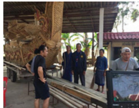
ภาพที่ 5 ถ่ายทำ