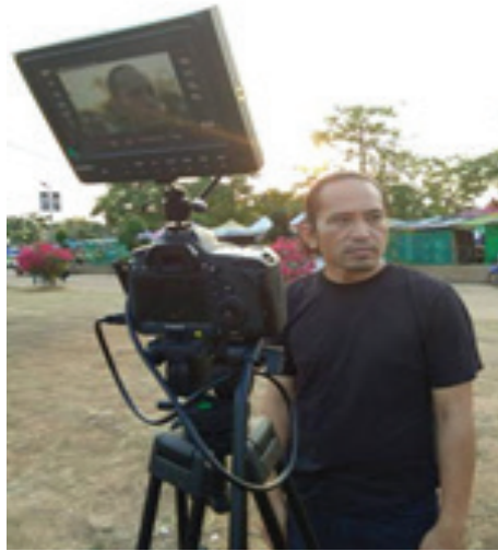
ภาพที่ 3 นักแสดง-ผู้ช่วยผู้กำกับ-ประสานงาน